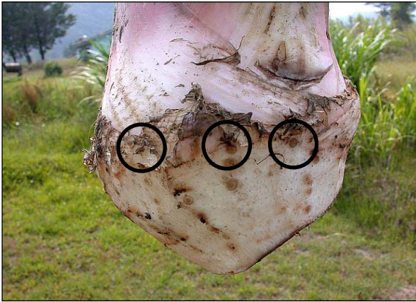
Figura 10. Muestra de la corona de yemas que no debe ser dañada.

Al eliminar tejido dañado de los cormos-semilla también se elimina tejido sano que de otra manera serviría de fuente de nutrientes, lo cual reduce su viabilidad y el vigor de las plántulas que emergieran, con alta probabilidad de que ocurra su muerte antes de desarrollar un sistema radicular apropiado. Por lo anterior, aquellos cormos que presentasen un daño demasiado severo que involucra profundizar mucho en su interior para cortar tejido dañado, será preferible desecharlos como material para siembra porque ocurren pérdidas altas de plantas una vez en el campo. Por las mismas razones, tampoco se recomienda este método para cormos muy pequeños (menores de 3 pulgadas de diámetro = 7 cm) porque al pelarlos mucho se reduce notablemente su vigor y viabilidad, con la consecuente pérdida de plantas en el vivero y campo. Finalmente, al efectuar el pelado se debe tener cuidado de no dañar la “corona de yemas” laterales (Figura 10), las cuales están ubicadas alrededor del corno-semilla en la zona donde se convierte en el pseudotallo.