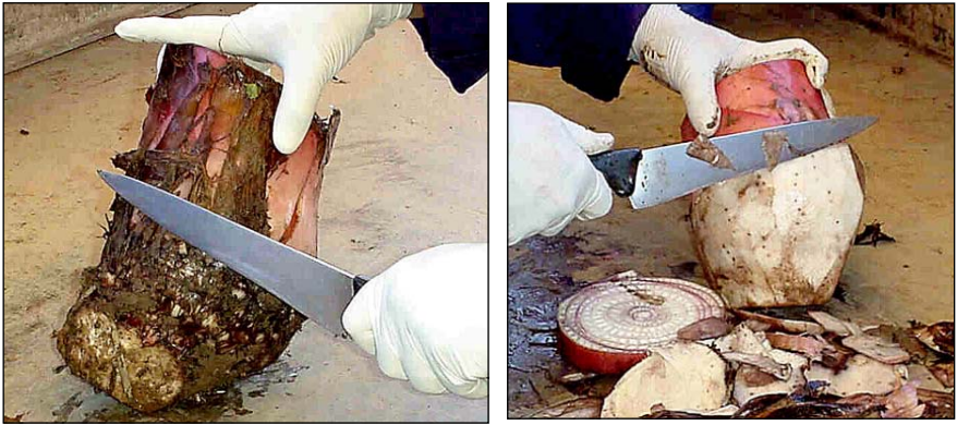
Figura 8. Eliminación del tejido externo dañado de un cormo de plátano.

que al finalizar el procedimiento se debe tener un cormo de color crema claro en su totalidad (Figura 9).