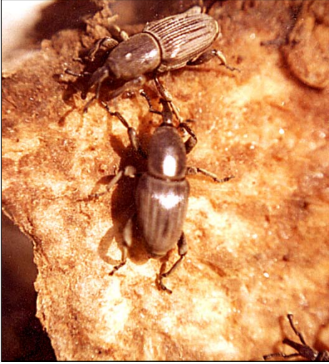
Figura 3. Adultos de Picudo negro ( Cosmopolites sordidus ).

respectivamente). Todos estos organismos pueden ir mezclados con el suelo que recubre los cormos-semilla desde donde se extrajeron, o bien pueden estar en el interior de los cormos colonizando el tejido.