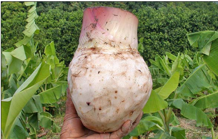
Figura 9. Aspecto que deberá tener el cormo después de la eliminación del tejido dañado.

Este tratamiento es muy eficaz y de bajo costo pero tiene algunas limitaciones. El cormo-semilla funciona inicialmente como una reserva temporal de nutrimentos para la nueva planta, la cual emergerá e iniciará su desarrollo dependiendo exclusivamente de dichas reservas mientras ocurre la emisión de suficientes raíces que le permitan absorber del suelo el agua y los nutrimentos requeridos para su desarrollo.