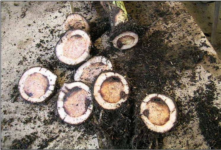
Figura 7. Síntoma de Mal de Panamá en cormos de plátano.