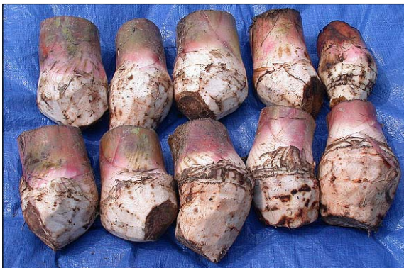
Figura 14. Cormos secados al aire libre y listos para siembra.

Este método es efectivo siempre que se sigan las instrucciones a cabalidad; sin embargo, presenta alto riesgo de toxicidad al humano como al medio ambiente, por lo que se recomienda preferentemente la utilización de cualquiera de los dos métodos inicialmente descritos en las secciones B.1 y B.2. De utilizar la desinfestación química, la persona encargada de la operación deberá utilizar durante toda la operación el equipo de protección adecuado consistente en: mascarilla, guantes de hule que cubran el antebrazo, anteojos protectores, delantal largo de caucho y camisa manga larga. El sobrante utilizado de la solución de pesticida puede ser aprovechado para aplicarlo con bomba de mochila al suelo de relleno y a los agujeros en los cuales se sembrarán los cormos-semilla en el campo. Para evitar obstrucciones en la boquilla será necesario colar dicho sobrante con un cedazo que remueva las partículas de suelo y tejido que se desprenden de los cormos-semilla durante el tratamiento.