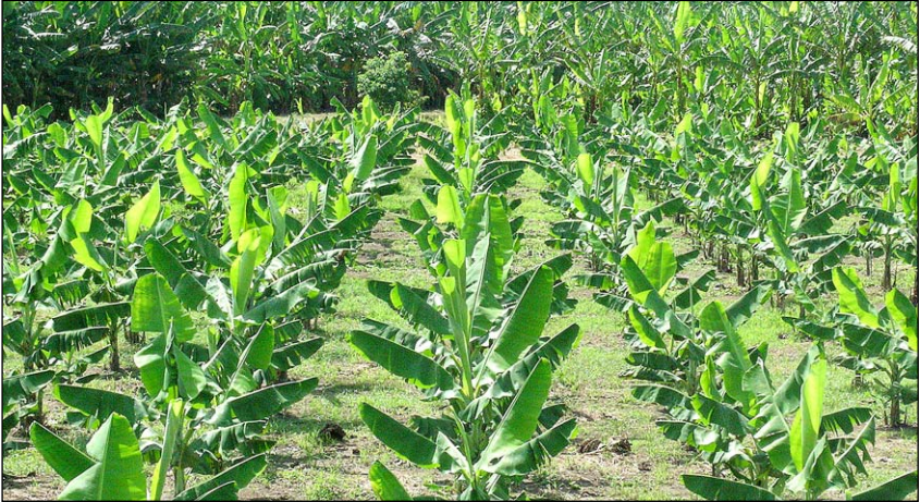
Las plantaciones de banano son afectadas por varias plagas del suelo como nematodos, hongos y bacterias.

En plantaciones de plátano y banano las plagas afectan negativamente la calidad y la cantidad de fruta producida, ocurriendo a veces situaciones de tal severidad que pueden provocar la muerte de las plantas afectadas. Algunas de dichas plagas, como los insectos, son muy evidentes por su tamaño; otros, como los hongos, bacterias y nematodos, son muy pequeños y no se pueden ver sin la ayuda de un microscopio. Cada uno de ellos usualmente atacan una parte específica de la planta, ya sea las raíces, las “cepas” o cormos, el tallo, las hojas, o bien los frutos mismos; no obstante, en algunos casos el efecto del daño puede observarse eventualmente en toda la planta, p.e., la marchitez general causada por algunos microorganismos. Por otra parte, con frecuencia ocurre la presencia simultánea de más de una plaga o enfermedad atacando una planta, lo cual aumenta la severidad del daño causado.