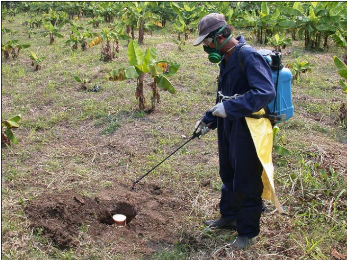
Figura 16. Aspersión de insecticida/nematicida al momento de la siembra.