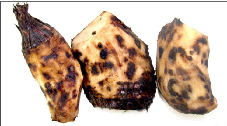
Figura 2. Cormos mostrando lesiones causadas por nematodos. Los cormos han sido parcialmente pelados con cuchillo para exponer el daño.

colonización del tejido afectado y a la agresividad del nematodo involucrado. Con los nematodos lesionadores y barrenadores las vías de entrada al interior de los cormos son los sitios de inserción de las raíces al cormo; en el caso del nematodo espiral penetran directamente las raíces. Puesto que habitan en el suelo, los nematodos fácilmente entran en contacto con las raíces y también con los cormos, incluyendo aquellos utilizados como material propagativo para nuevas siembras. Dichos cormos-semilla son el medio más eficiente de diseminación de nematodos a las nuevas plantaciones. En plantaciones establecidas cuyos suelos están naturalmente infestados por nematodos se requiere la aplicación programada de nematicidas o de otras prácticas de manejo, lo cual puede consultarse en otras publicaciones.