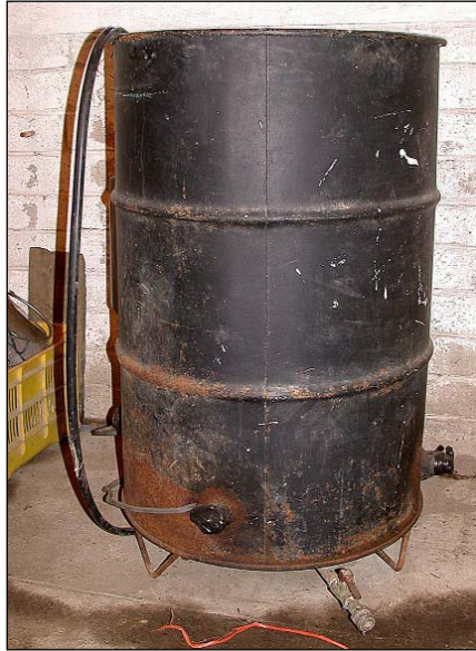
Figura 11. Barril utilizado para la desinfestación.

removible y con múltiples perforaciones, bajo el cual se instalan cuatro resistencias (c/u de 240 voltios y 4000 vatios) conectadas externamente a un panel eléctrico externo con termostato que permita ajustar a la temperatura deseada (Figura 11).