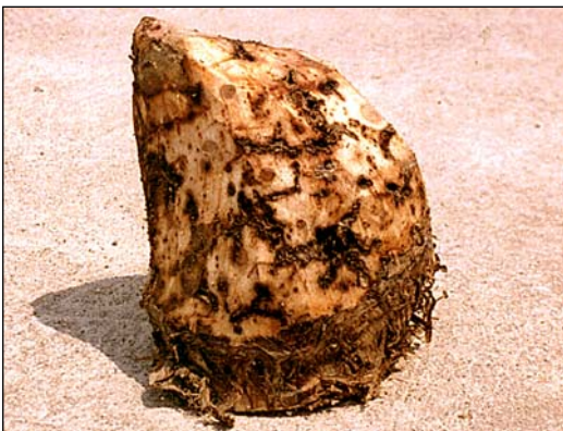
Figura 4. Daño de larvas de Picudo negro en la periferia del corno de una planta de plátano.

atacadas por Pudrición suave usualmente solo morirá la planta madre y las generaciones posteriores producirán sin problema. Al igual que en el caso de los nematodos, existen procedimientos para el manejo de estos problemas del suelo en plantaciones establecidas que pueden consultarse en otras publicaciones.