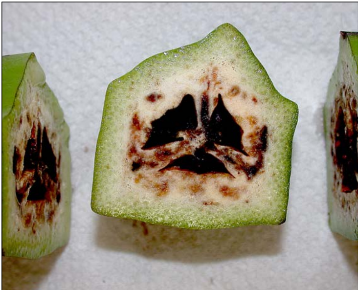
Figura 6. Síntoma de Moko en fruto de banano.