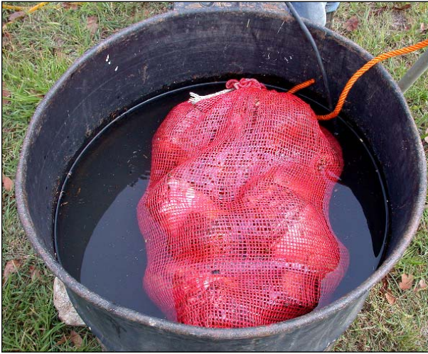
Figura 12. Inmersión de los cormos en el barril con agua caliente a 55 °C.

Una fogata generada quemando leña u otro material combustible también puede utilizarse para la desinfestación de cormos-semilla con calor. Para ello también se utiliza un barril, cortado longitudinalmente para obtener con cada mitad dos canoas que se colocan horizontalmente, o bien utilizado entero y en posición vertical (Figura 13); además, puede equiparse con agarraderas laterales que facilitan su transporte y manejo. El barril se coloca sobre horquetas u otra estructura metálica apropiada a una distancia no menor a 50-60 centímetros de la fuente de calor bajo el, y se llena con agua. Una vez que se observa que el agua está hirviendo (100 grados Celsius) se sumergen en ella los sacos o canastas conteniendo los cormos por un período de 30 segundos, lo cual bastará para obtener el efecto deseado.