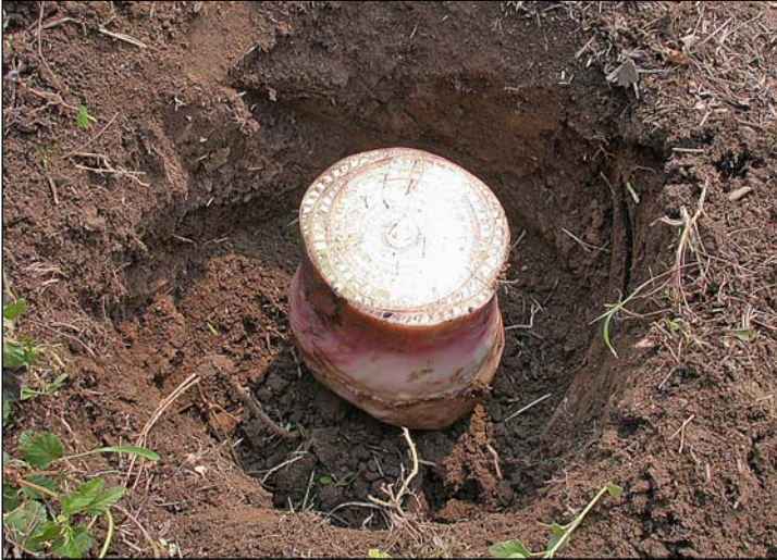
Figura 15. Cormo depositado en el agujero.