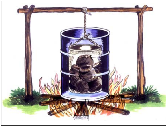
Figura 13. Desinfección de cormos con agua caliente.

los cormos-semilla siempre se deberá (i) inspeccionarlos para determinar su condición sanitaria y elegibilidad (aquellas que muestran daño profundo deben eliminarse), (ii) eliminar la totalidad de las raíces que tengan y aquellas partes con tejido dañado que mostraran. En este caso el “pelado” del corno-semilla no tiene que ser tan drástico como cuando el “pelado” es el único tratamiento aplicado.