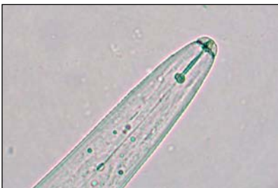
Figura 1. Parte anterior del nematodo barrenador ( Radopholus similis ).

Los nematodos son gusanos alargados que habitan en el suelo, de tamaño extremadamente pequeño (se requiere de un microscopio para verlos). Algunos de ellos, conocidos como nematodos fitoparásitos o fitonematodos, poseen en su boca un órgano especializado hueco y afilado llamado “estilete” (Figura 1), con el cual perforan las células de las raíces y succionan su contenido para alimentarse. Además, las heridas que provocan sirven de entrada a hongos y bacterias presentes en el suelo, causando pudriciones que provocan la destrucción generalizada de las raíces. Todo este daño causado a las raíces disminuye drásticamente su capacidad de absorción y de transporte de agua y nutrientes, lo cual eventualmente podría repercutir negativamente en la productividad de las plantas atacadas. En plátano y banano generalmente el daño más importante es la pérdida de plantas (y sus racimos) porque se vuelcan al faltar el anclaje que normalmente les proporcionarían las raíces sanas.